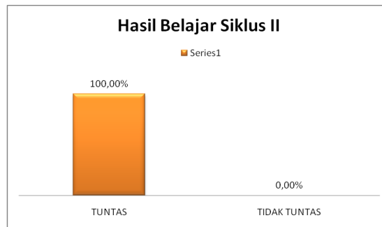
Diagram 3. Persentase hasil belajar Siklus II

Hasil belajar Akidah Akhlak pada siklus II mengalami peningkatan yang signifikan dibanding dengan siklus sebelumnya. Semua siswa berhasil (100%) menggapai kriteria ketuntasan standar nilai KBM dengan nilai rata-rata 83,57%. Hal ini menandakan bahwa metode pembelajaran berbasis inkuiri telah berhasil meningkatkan hasil belajar siswa pada kelas VII semester 1 MTs Wirdullatifah Banjar Manis.