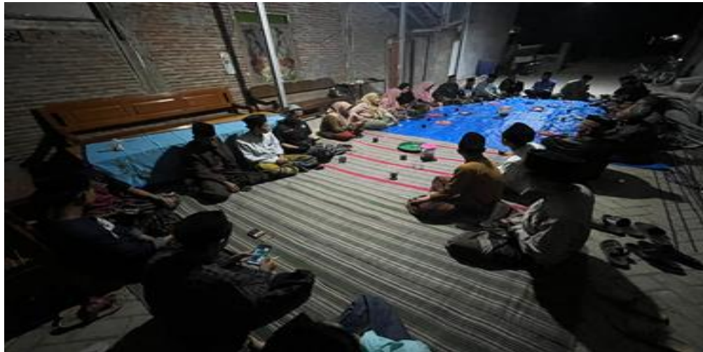
Gambar 3. Focus Group Discussion

perwakilan dari berbagai elemen masyarakat seperti tokoh perangkat desa, tokoh agama, karang taruna, hingga remaja musholla.