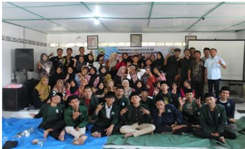
Gambar 2 : Pelaksanaan Pelatihan Fotografi

Tahapan Pelatihan meliputi: pemilihan tempat dengan pemandangan yang bagus, pembelajaran tentang pengambilan sisi potret, praktik foto, memasukkan hasil jepretan foto ke laptop, pembelajaran desain dasar dengan menggunakan aplikasi canva.