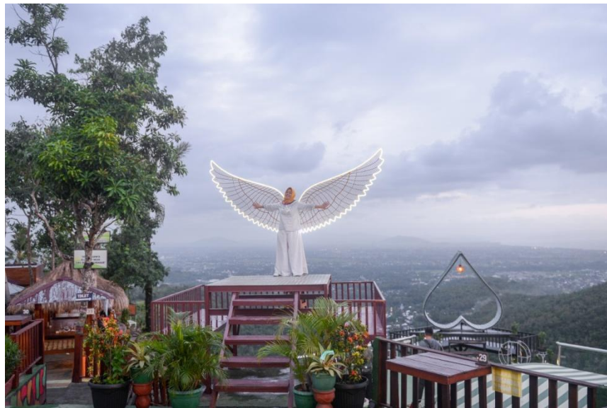
Gambar 2 : wisata taman langit bukit bengkaung

Taman langit bukit bengkaung merupakan destinasi wisata yang terletak di Dusun Bunian, Desa Bengkaung, Kecamatan Gunungsari, Kabupaten Lombok Barat, NTB. Wisata taman langit bukit bengkaung menyajikan pesona wisata yang sangat indah, dimana wisata yang disajikan yakni hamparan luas kota mataram hampir seluruhnya. View mempesona ini sendiri dikolaborasikan dengan penataan lokasi yang sangat representatif dari situasi dan kondisi tempat yang disediakan. Lokasi wisata taman langit ini sendiri terletak di daerah perbukitan, sehingga akses untuk mencapai lokasi ini memang bisa dibilang memacu adrenalin.