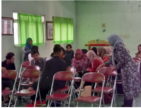
Gambar 2. Dokumentasi Sesi Pelatihan dan Pendampingan