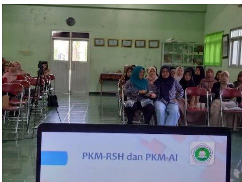
Gambar 1. Dokumentasi Sesi Sosialisasi

Tim pengabdian akan memberikan pendampingan secara langsung dalam proses penulisan karya ilmiah, termasuk bimbingan dalam menyusun rancangan PKM yang sesuai dengan ketentuan jurnal ilmiah terkait. Sebelum sesi penyampaian materi dimulai, peserta diwajibkan mengisi Pre-Kuesioner. Tujuan dari pengisian kuesioner awal ini adalah untuk mengidentifikasi tingkat kecemasan peserta sebelum materi disampaikan. Terdapat lima butir pertanyaan dalam kuesioner tersebut.