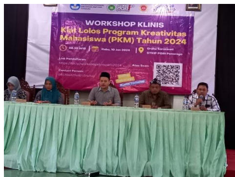
Gambar 3. Dokumentasi Sesi Monitoring dan Evaluasi

Pada tahap ini, mahasiswa bersama pemateri melakukan refleksi terhadap proses dan hasil yang telah dicapai. Jika ditemukan kekurangan atau ketidaksesuaian, maka dilakukan perbaikan melalui proses modifikasi atau revisi terhadap karya yang telah dibuat. Proses evaluasi ini tidak hanya berfungsi sebagai alat ukur keberhasilan pelatihan, tetapi juga sebagai sarana pembelajaran berkelanjutan yang mendorong mahasiswa untuk terus meningkatkan kualitas karya ilmiahnya.